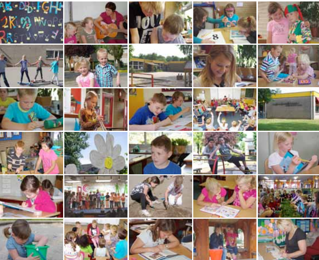
Schoolgids Willem Alexanderschool 2011-2012

Willem Alexanderschool | Rooboerskamp 19-21 | 8181 TZ Heerde | T 0578-692946 | F 0578-697266 E wa-school@willemalexanderschool.nl | www.willemalexanderschool.nl